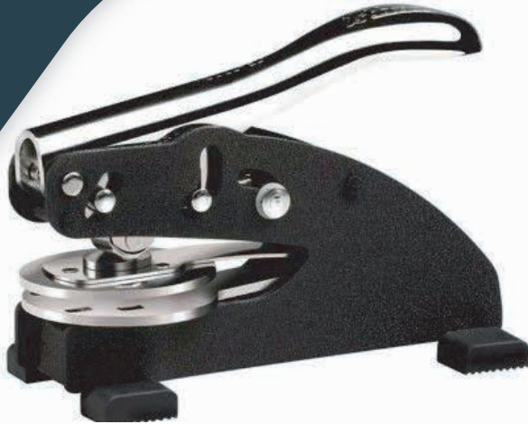
Sello Seco de escritorio Uso continuo Disponible desde 1 a 2 pulgadas RD$ 4,800.00