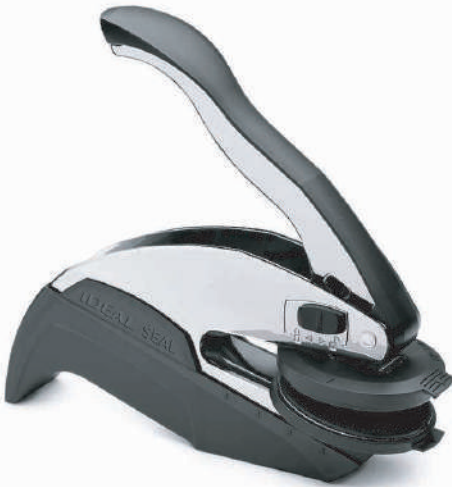
Sello Seco de escritorio Manual Disponible desde 1 a 2 pulgadas RD$ 3,500.00